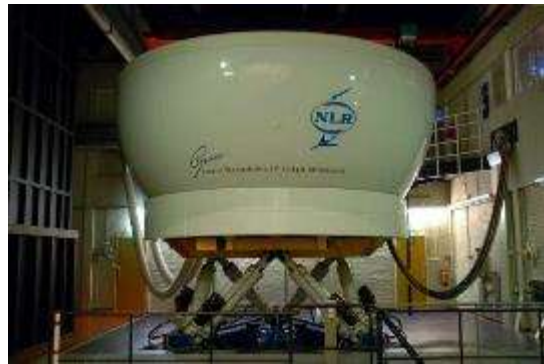
GRACE Generic Research Aircraft Cockpit Environment