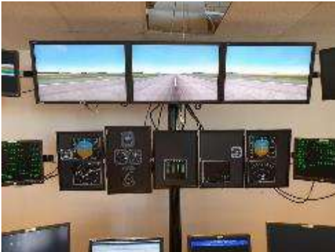
Simulator controle kamer

het materiaal is in het NTM in opslag. Het is de bedoeling dat de tentoonstelling verkleind hier opnieuw wordt opgezet.