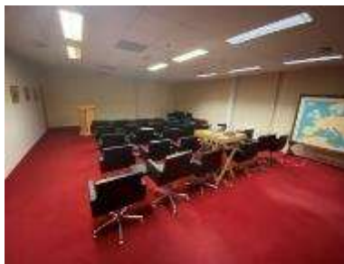
Vergaderruimte 'VIP kamer'