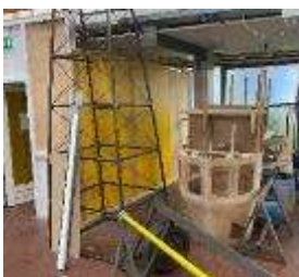
Romp D-7 en G-1

Alle objecten (props genoemd in de filmwereld) die gebruikt zijn voor de opnames van de diverse scenes staan in de expositie met toelichtende tekst en de betreffende filmbeelden uit de serie.