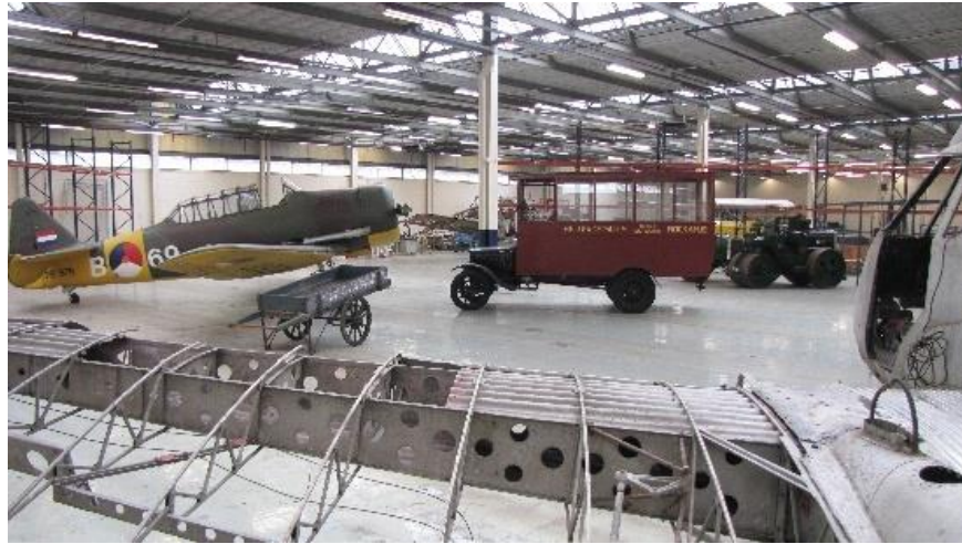
Het museum - Anno april 2018